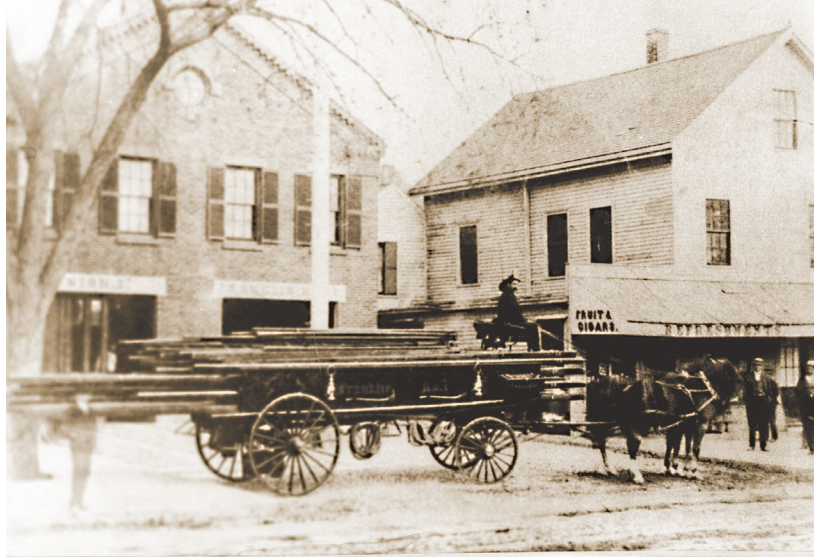
CHC. Koutwazi Christian Mission Holiness Church.

Li te konstwi an 1852 e se te pi gwo pami twa estasyon ponpye vil la e kounye a li se pi ansyen baz ponpye entak Cambridge. Apre yo te fin konstwi yon nouvo estasyon ponpye nan Lafayette Square an 1894, ansyen bilding nan vin pase yon seri pwopriyetè jiskaske Christian Mission Holiness Church vin achte li an 1916.