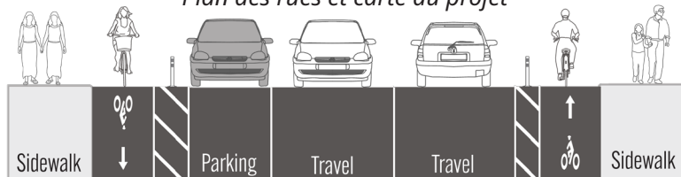
Plan des rues et carte du projet

Inscrivez-vous pour recevoir les mises à jour par e-mail