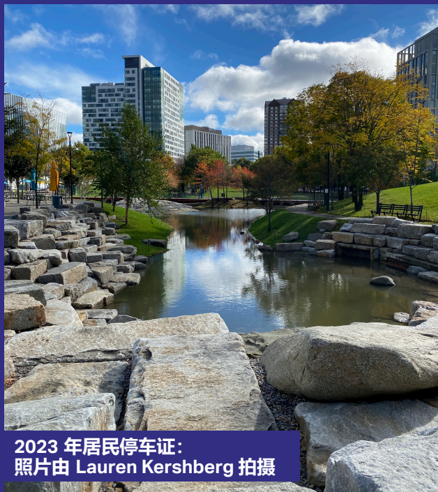
2023 年居民停车证: 照片由 Lauren Kershberg 拍摄

Cambridge 市 Traffic, Parking, + Transportation (交通、停车和运输部)