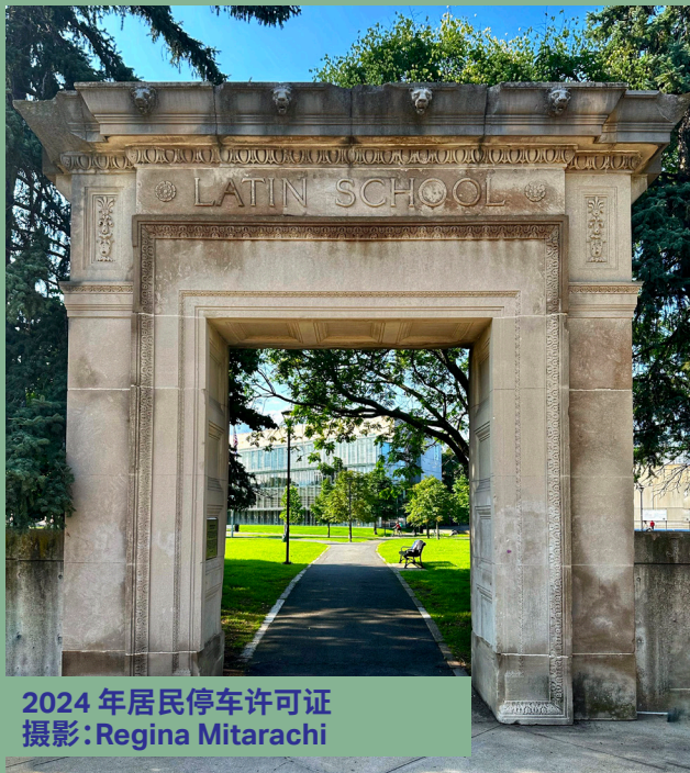
2024 年居民停车许可证