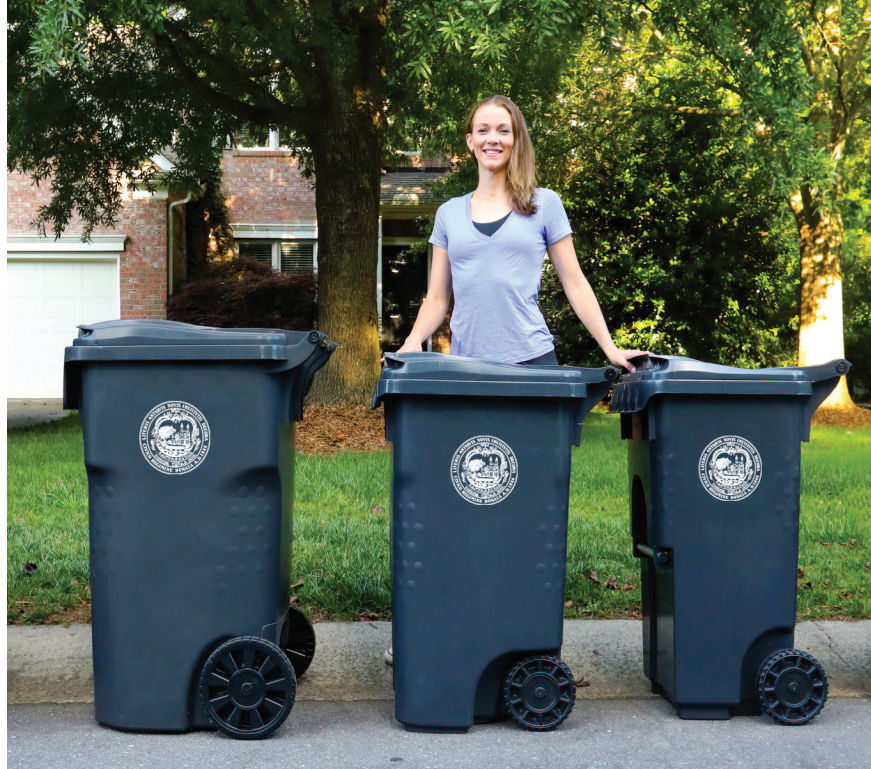
Um exemplo de três carrinhos de lixo diferentes que a cidade pode selecionar para o novo programa.

No início de 2022, a cidade sediará uma reunião da comunidade sobre o novo programa. A Prefeitura também enviará um cartão postal com informações sobre quando esperar o novo cesto de lixo e como descartar o(s) barril(s) de lixo(s) antigo(s). Os novos carrinhos de lixo virão em três tamanhos diferentes para acomodar diferentes tamanhos de edifícios. Inscreva-se no boletim mensal da cidade sobre reciclagem, compostagem e lixo para se manter atualizado sobre este programa e outros programas de resíduos na cidade em Cambridgema.gov/Subscribe .