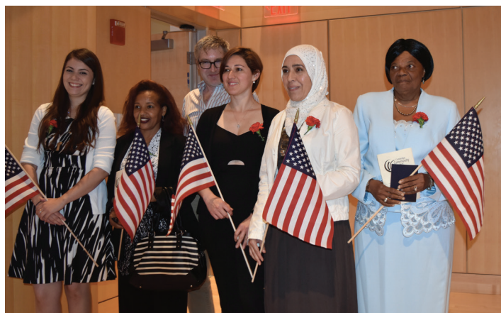
Foto da formatura da turma de cidadania tirada antes da pandemia de COVID-19.

Como parte do DHSP, os alunos do CLC podem ter acesso a creches, moradia e recursos de emprego disponíveis na cidade e em outras organizações comunitárias. A Equipe de Engajamento da Comunidade (CET), com base